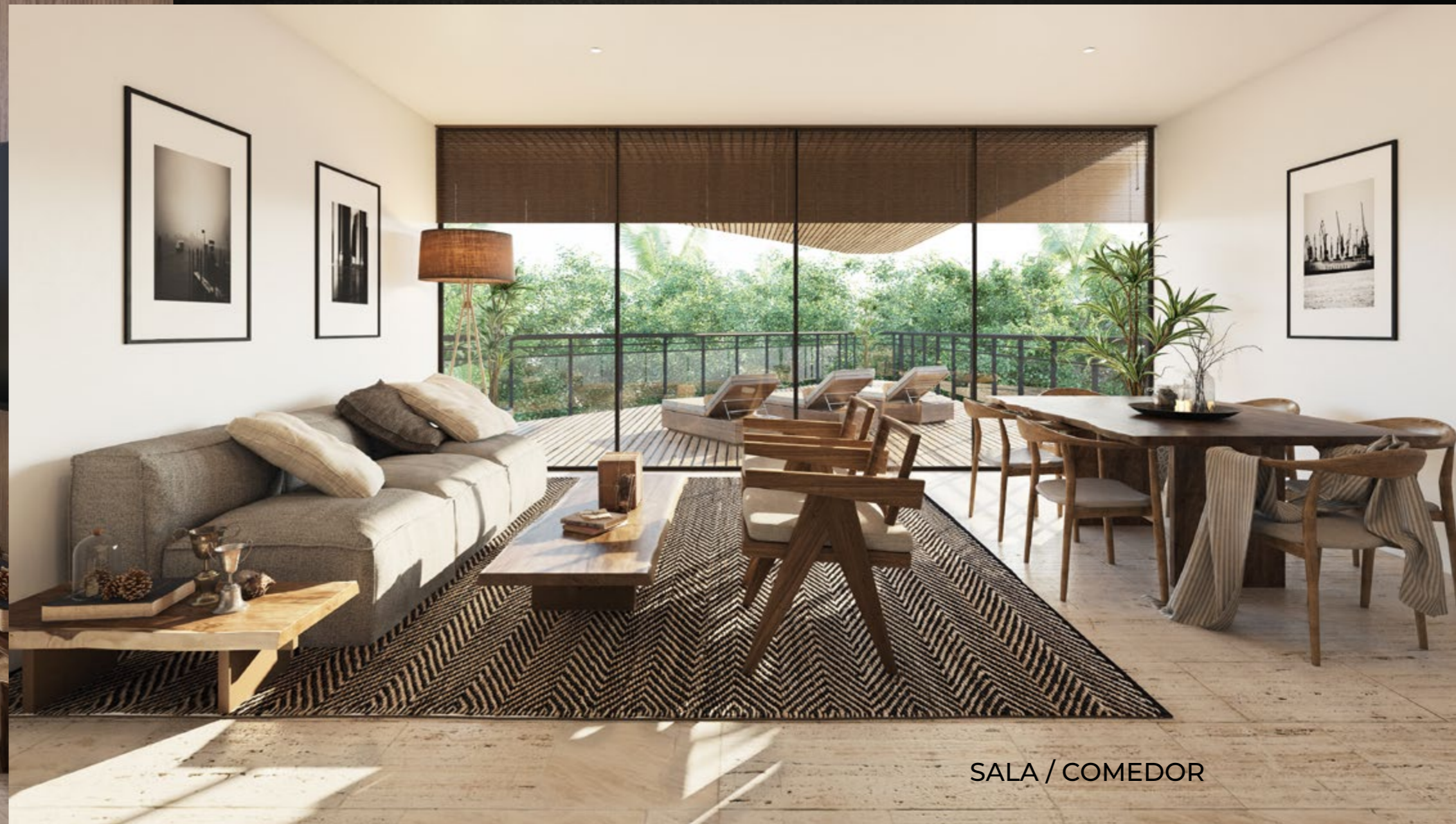
SALA / COMEDOR